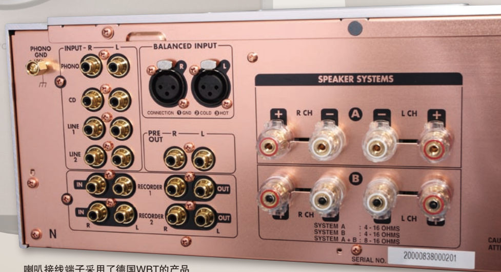
喇叭接线端子采用了德国WBT的产品