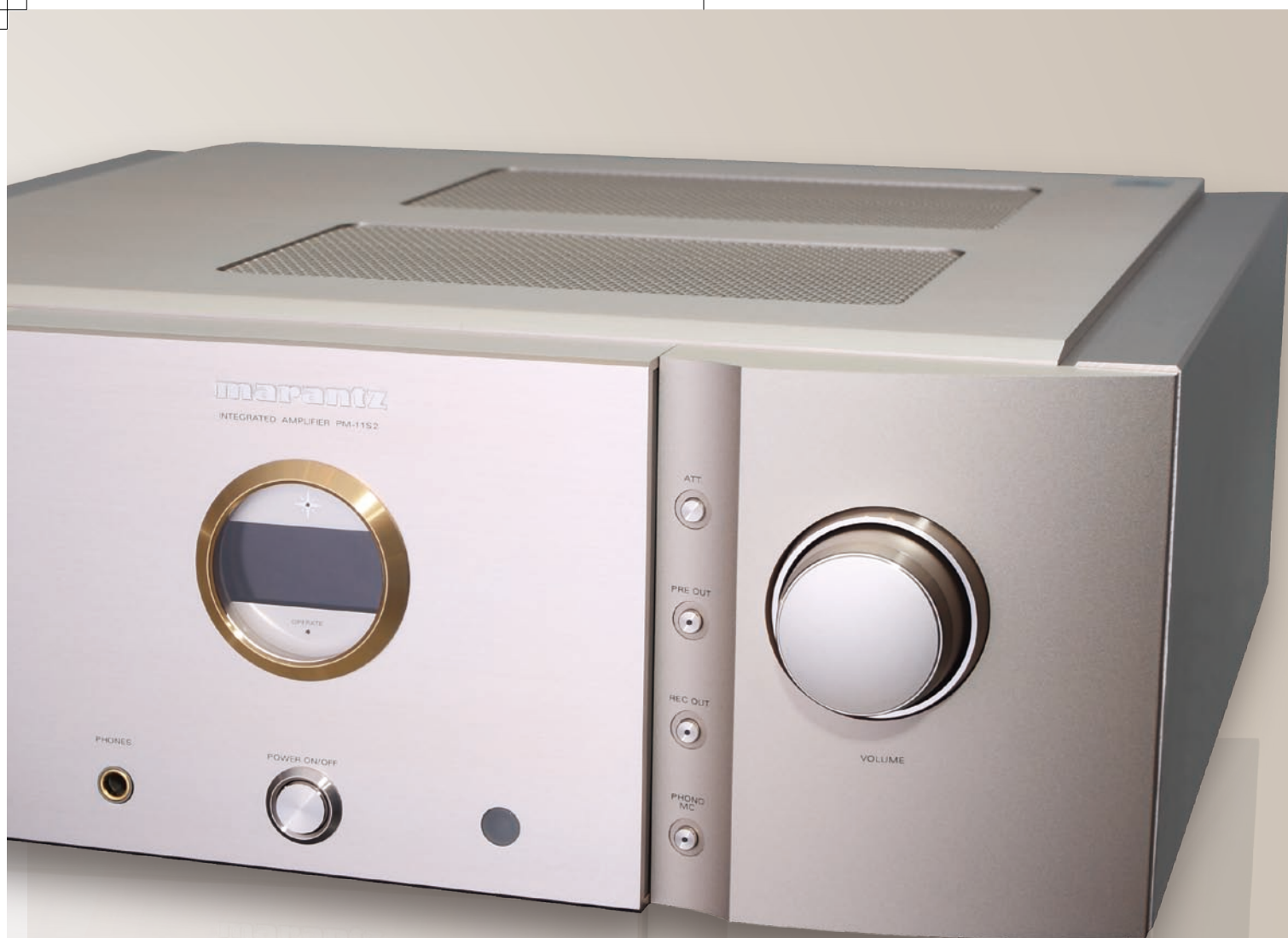
器材提供：鸣谢广州典雅音乐花园