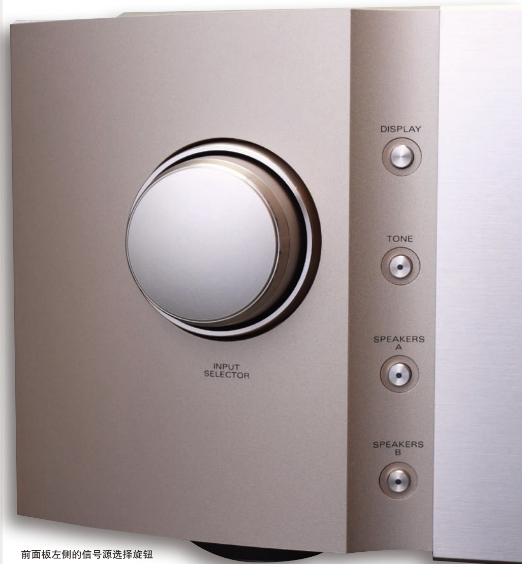
前面板左侧的信号源选择旋钮

播放《莫扎特的钢琴协奏曲》，作品第414号和第491号（编号：DG 477 7167）时，钢琴在中低音以上的绝大部分发音区域内，都显现出中性的色彩和良好的透明度，每一个音符从发出到消逝整个过程的各个细节都纤毫毕现，并蕴含了摄人的张力和冲击力，有如亲临现场般的真实和生动。播放威尔第的歌剧《阿依达》（编号：DECCA 414 087-2）时，无论是主