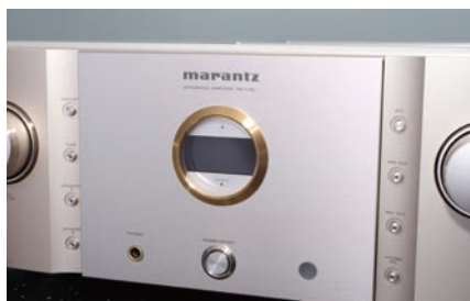
在前面板中央区域，镶了一圈做工极为精致的金边工作信息显示窗；两旁竖向整齐排列分布的功能按钮，操作方便